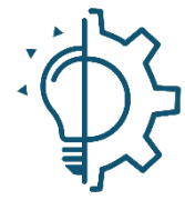
Learn to improve