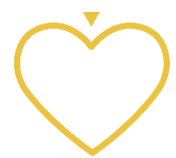
Love what we do