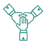
We're in it together

Ta candidature : Envoie ton CV à notre service RH : careers.france@wellsandco.com